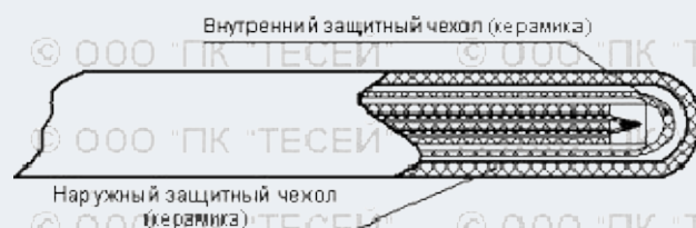
Конструкция рабочей зоны термопреобразователей ТППТ(ТПРТ) 01.20